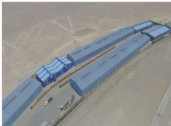
3. Modernización Antepuerto Portezuelo