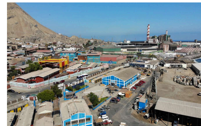
Construcción Puerto de Tocopilla