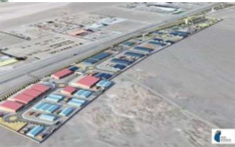
ZONA DESARROLLO LOGÍSTICO