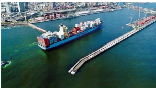
1. Ampliación del Molo