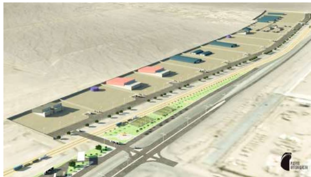
2. Zona Desarrollo Logístico La Negra